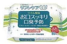
口腔清拭シート リフレケアW