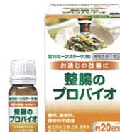
整腸のプロバイオ

お申し込みの際の注意事項がございますので、申込フォームをご参照の上、ご登録ください。