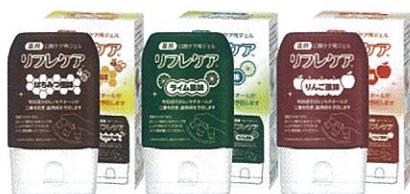
薬用 口腔ケア用ジェル リフレケア