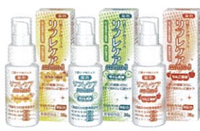
薬用 口腔ケア用ジェル リフレケア mint